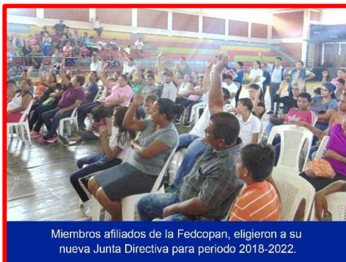
Miembros afiliados de la Fedcopan, eligieron a su nueva Junta Directiva para periodo 2018-2022.

Tomas, Sto. Domingo, El Almendro y Nueva Guinea. Y entre otras actividades se efectuaron también: en Leon el evento Atleta Joven con el fin de buscar nuevos talentos deportivos (60 atletas, que incluyeron a niños con parálisis cerebral severo) mientras que en Matagalpa, se realizó el Torneo Regional de Goalball en donde compitieron atletas de Jinotega, Somoto, Estelí, Ocotal y el anfitrión, Matagalpa.