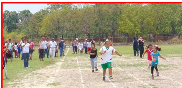
Atletas con discapacidad del municipio de Condega participaron en las competencias Interdepartamentales de Atletismo.

El 1 de septiembre se realizó la eliminatoria Interdepartamentales de Atletismo de los Pipitos en el municipio de Condega que tuvo como sede el Estadio de Béisbol de la localidad, donde asistieron un total de 65 atletas originarios de Pueblo Nuevo, Telpaneca, Somoto Y Condega, con las discapacidades de parálisis cerebral, sordos, deficientes intelectuales, síndrome de