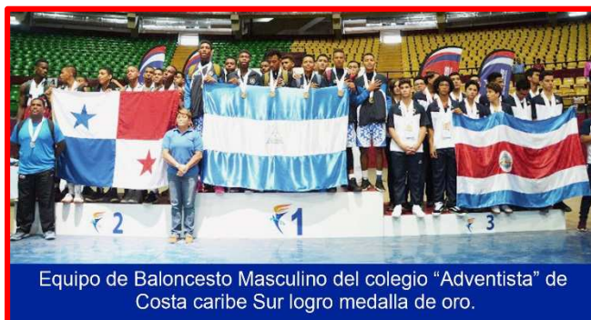
Equipo de Baloncesto Masculino del colegio "Adventista" de Costa caribe Sur logro medalla de oro.

sobresalió el Baloncesto masculino el que fue representado por el colegio "Adventista" de la Costa Caribe Sur consiguiendo la medalla dorada de forma invicta 6-0 en el balance de juegos ganados y perdidos. El equipo fue conducido por el entrenador