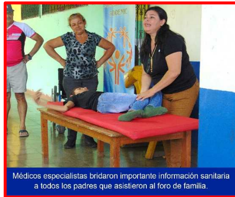
Médicos especialistas brindaron importante información sanitaria a todos los padres que asistieron al foro de familia.

Así mismo, para el viernes 21 de Septiembre en el gimnasio "Iván Montenegro" de la ciudad de Leon, se realizó la Asamblea General para elegir a la nueva directiva de la Asociación Deportivas de Olimpiadas Especiales de Nicaragua ADOENIC para el periodo 2018-2022. Luego de los respectivos