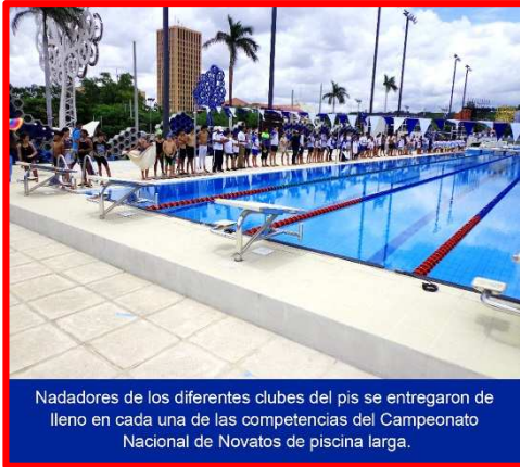
Nadadores de los diferentes clubes del país se entregaron de lleno en cada una de las competencias del Campeonato Nacional de Novatos de piscina larga.

Fue una tarde inolvidable para el Club Nica Nadadores (Managua), que arrasó en el medallero general al sumar 15 preseas doradas, 13 medallas de plata y 14 de bronce, para un total de 42 y subir a lo más alto del pódium por equipo en el Campeonato Nacional de Novatos Piscina Larga 2018.