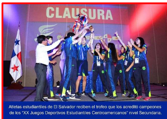
Atletas estudiantiles de El Salvador reciben el trofeo que los acreditó campeones de los "XX Juegos Deportivos Estudiantiles Centroamericanos" nivel Secundaria.

Los XX Juegos Deportivos Estudiantiles Centroamericanos fueron ganados por El Salvador que se coronó como el rey escolar de la región tras conseguir 122 preseas, de las cuales 47 fueron de oro, 37 de plata y el resto de bronce, y detrás se ubicaron, Costa Rica (130), Guatemala (152), Panamá (111), Honduras (56) y Belice con solamente dos medallas de bronce. La próxima edición de dichos Juegos será en el 2020 en El Salvador.